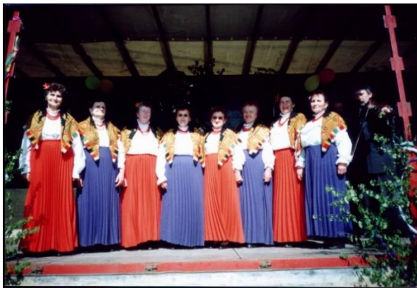
Zespół „Grodzic” podczas występu z okazji „Dni Grodzca

Instytucja Zarządzająca Programem Rozwoju Obszarów Wiejskich na lata 2014-2020 – Minister Rolnictwa i Rozwoju Wsi. Operacja współfinansowana jest ze środków Unii Europejskiej w ramach działania 19 „Wsparcie dla rozwoju lokalnego w ramach inicjatywy LEADER”