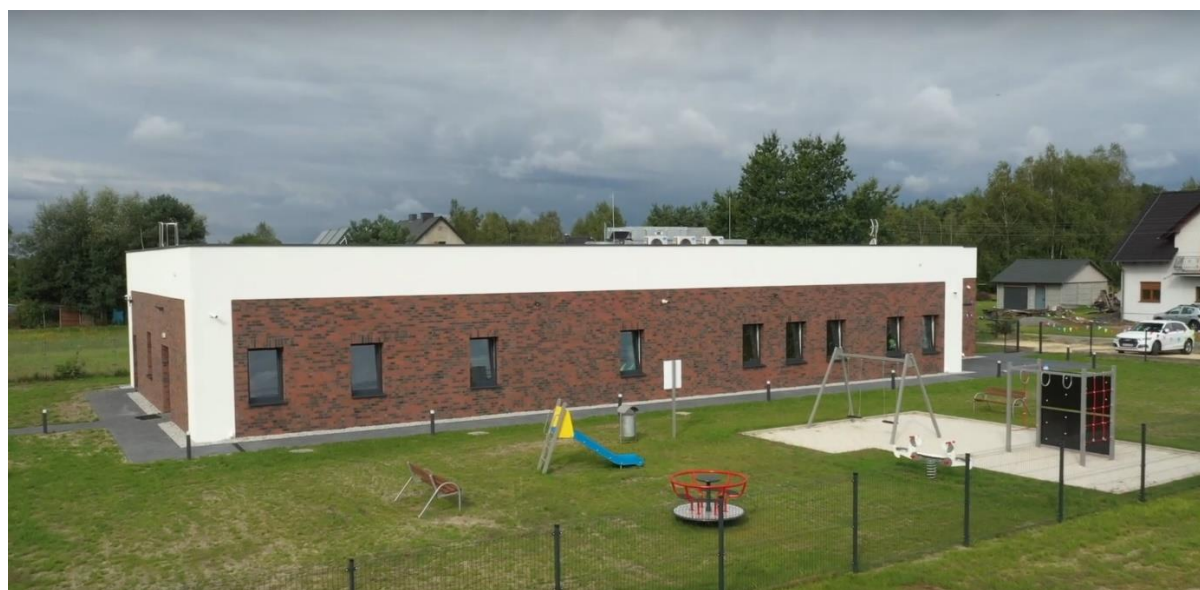
Budynek przedszkola w Grodzcu

Na terenie sołectwa funkcjonuje Zespół Szkolno-Przedszkolny im. Mikołaja Kopernika, gdzie uczęszczają także dzieci z sąsiednich sołectw Chobia i Mnichusa. Szkoła jest dobrze wyposażona w urządzenia dydaktyczne, oferuje zajęcia z języków obcych (angielski, niemiecki). W nowym, oddanym do użytku w 2022 r. budynku przedszkola mogą odbywać się zajęcia dwóch 25 osobowych grup.